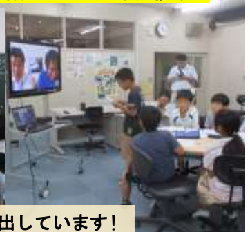
タブレット端末 (1 人一台) など ICT 機器の活用で主体的な学びを生み出しています！