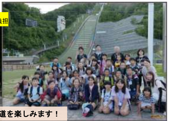
学校の枠を超えての体験活動で夏の北海道を楽しみます！

カナダ英語研修 (9 泊 10 日 / 中学校 2 年生) ※経費は町が 8 割負担