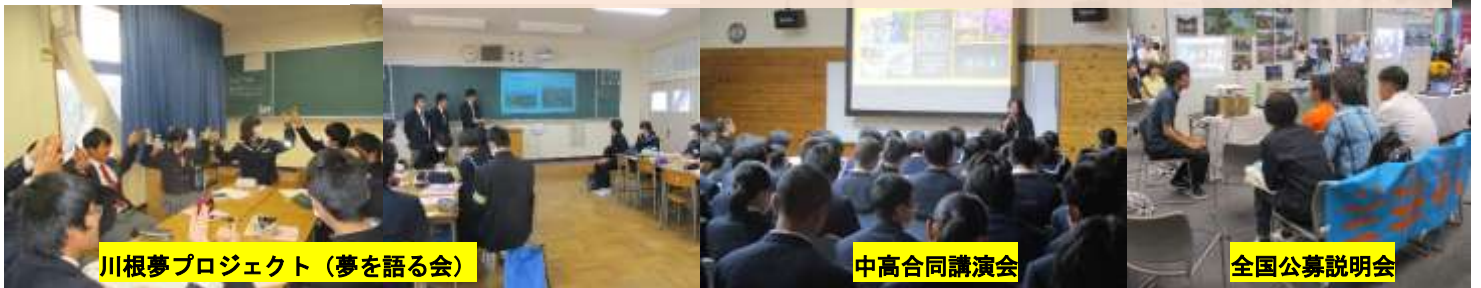
川根夢プロジェクト（夢を語る会）

町内の2中学校は、川根高校と連携型中高一貫教育を進めています！（平成14年度から）