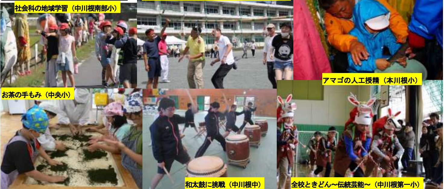
社会科の地域学習（中川根南部小）