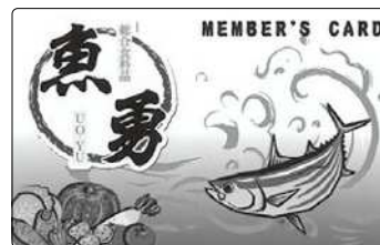
◆魚勇プリペイドカード

皆さまのご近所に「移動手段がなく当店にご来店できない」など…お買い物にお困りの方がいらっしゃいましたら、ぜひ一緒にお連れいただければ助かります。その際、引率者の方へ茶娘ちゃんカードのお買い物ポイントを5倍進呈させていただきます。