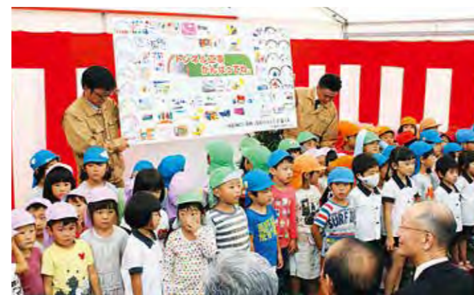
▲起工式には70人の園児が駆けつけ、応援ボードを贈呈した