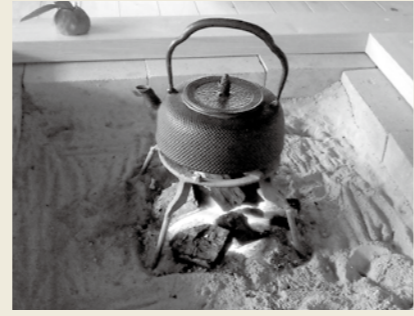
相模園古民家の囲炉裏。風情があり好評。1/28「川根茶染めと囲炉裏ごはん」で使用。

新しい年を迎えましたが、引き続き成長していくエコティを見守っていただけたら幸いです。事務局にも遊びに来てくださいね。