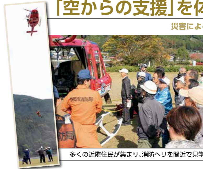
多くの近隣住民が集まり、消防ヘリを間近で見学

高郷河川敷多目的広場(高郷区)にて、消防ヘリを活用した訓練が行われ、静岡市消防局航空隊と島田消防署の隊員約20人、尾呂久保地区と八中地区の自主防災会員5人が参加しました。