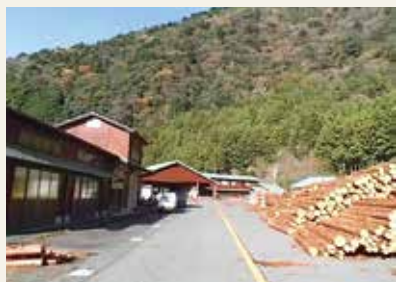
広大な桑野山貯木場。もともと営林署の貯木場として使われていました。

今、活動の拠点としている桑野山貯木場には、門を入ってすぐの所に「木の駅かわね」の集荷場があり、毎日木材が運ばれてきています。貯木場内の建物は、茶箱製造の前田工房さん、メン