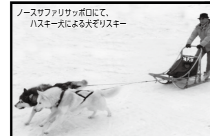
ノースアフリカサッポロにて、ハスキー犬による犬ぞりスキー

新年明けましておめでとうございます 今年も川根自動車を、よろしくお願いたします。