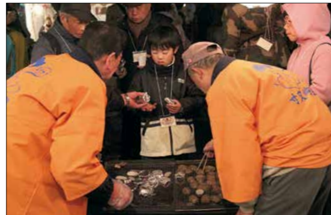
冷え込む会場では、熱々の里芋や八つ頭が人気を集めた

会場では、山の幸をふんだんに使った鍋料理やそばなどが来場者に振る舞われたほか、ステージでは赤石太鼓の演奏や「第12回和紙のあかり展」入賞者の表彰などが行われました。また、てんぐや山伏にふんした組合員やたいまつを持った地元住民らが温泉街を練り歩き、使われなくなった道具を供養するとともに温泉街のさらなる発展を祈願しました。