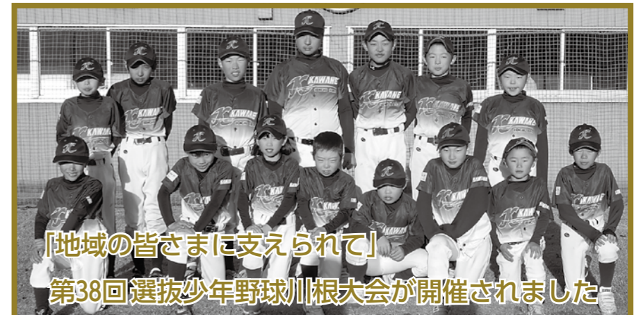
「地域の皆さまに支えられて」