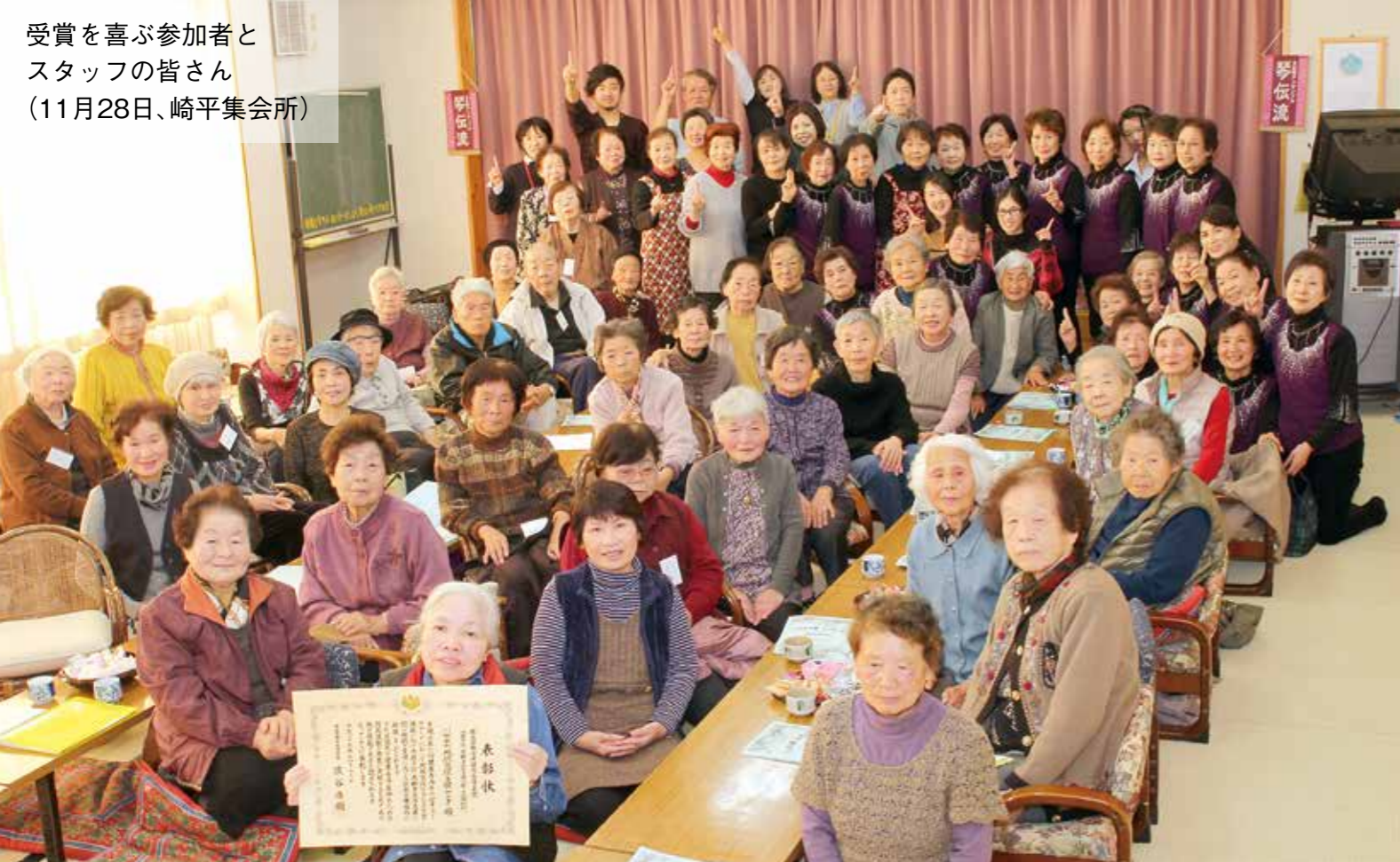
受賞を喜ぶ参加者と スタッフの皆さん (11月28日、崎平集会所)