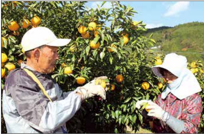
「さわやかな香りをぜひ堪能してほしい」と話す和充さん◎

「しずおか食セレクション」認定、作付面積・生産量が県内一の町内で、収穫作業が行われました