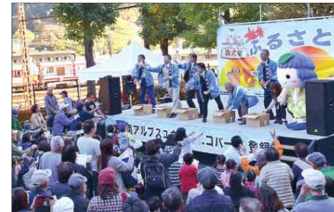
最後の「景品付き餅投げ」では、多くの参加者で盛り上がった

秋空の下、訪れた来場者は販売・展示ブースで地場産品を買い求めたり、特設ステージでの催しを楽しみました。