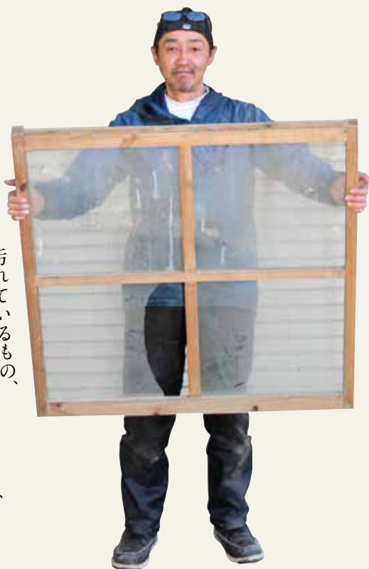
汚れているもの、一部が割れているものも、大歓迎です！

現在、古民家をお借りして暮らしています。友人の住む古民家も、頼まれて少しずつ修理したりもしています。そこで困るのが、木製の建具のガラス。割れてしまっていると、なかなか合うガラスがないのです。場合によっては建具を一度分解しますが、昔の透明のガラスは、キレイに拭いて組み立て直すと角度によって波のように景色がゆがんで見えます。これも何だか懐かしいような気持ちになり、とても気に入っています。窓をアルミサッシに交換し物置に古い建具やガラスがある方、処分したいと考えている方、ぜひ連絡いただけたらうれしいです。