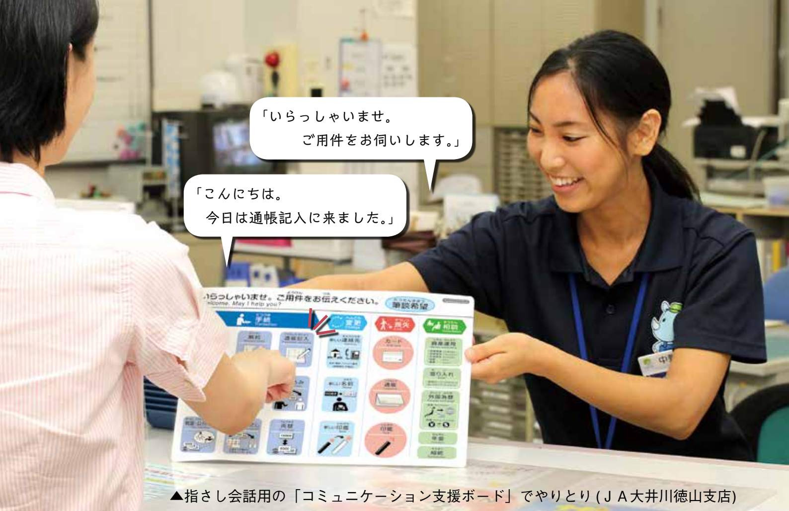
▲指さし会話用の「コミュニケーション支援ボード」でやりとり（JA大井川徳山支店）