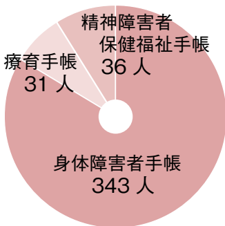
▲各手帳の所持者数 (平成29年8月1日現在) ※複数の手帳の保持者は、各手帳の所持者数に計上。

この町では「17人に1人」 町では、障がいのある方に対し、その種別に応じて、「障害者手帳」を交付しています。町内で手帳を持っている人は、平成29年8月1日現在で、延べ410人。これは、町民の17人に1人が所持している計算となります。日本全体では26人に1人、県内では21人に1人となっており、比較的高い割合であるといえます。障がいのある人とそうでない人の間には、無関心や差別、偏見の意識から生じる、さまざまな「壁」が存在しています。しかし、その障害自体は、生まれつきのものでなく、事故や病気、加齢などが原因となる場合もあり、いつ誰にでも起こりうる身近なものです。だからこそ、その壁を「自分事」と捉えて取り払っていくことは、いつまでもこの町で暮らし続けたいと願うすべての人にとって、取り組む意味のあることといえるはずです。