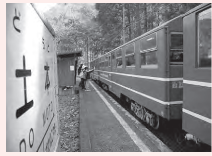
土本駅で降りて列車に手を振る参加者。

● 既存 の観光地ではない場所にお客様をお連れするには、看板やトイレなどの設置はもちろんですが、住民の皆さんの理解と協力が不可欠です。エコティはこぢんまりした活動しかできませんが、今後も大井川鐵道本線並びに井川線を活用していきたいと思っているので、沿線の皆さん、ご協力よろしくお願ひいたします。せっかく全線開通したのだから、井川とコラボした企画も検討したいです。