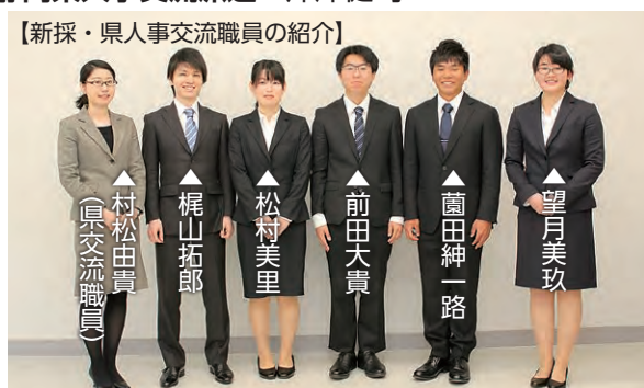
【新採・県人事交流職員の紹介】