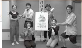
U35みらい創造会議の開催