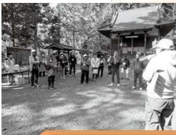
町内学習会の開催

●「日本で最も美しい村」連合とは この連合は、素晴らしい地域資源を持ちながら過疎にある美しい町村や地区が、自ら「日本で最も美しい村」であることを宣言し、以下のことに取り組んでいく組織です。 ①自らの地域に誇りを持ち、将来にわたって美しい地域づくりを行うこと。 ②住民によるまちづくり活動を展開することで地域の活性化を図り、地域の自立を推進すること。 ③生活の営みにより作られてきた景観・環境を守り、これらを活用することで観光的付加価値を高め、地域の資源の保護と地域経済の発展に寄与すること。 令和5年4月現在、北海道から沖縄県まで、61の町村・地域が加盟しています。