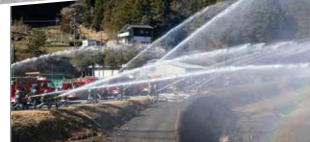
全分団による一斉放水。見学した住民らも歓声を上げた

令和5年川根本町消防団出初式が、中川根中学校体育館およびグラウンドで開催されました。