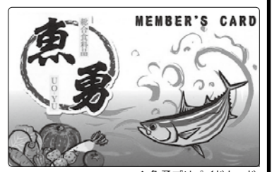
◆魚勇プリペイドカード