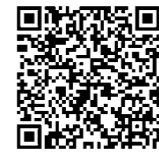
▲土砂キキクル (気象庁土砂災害情報)