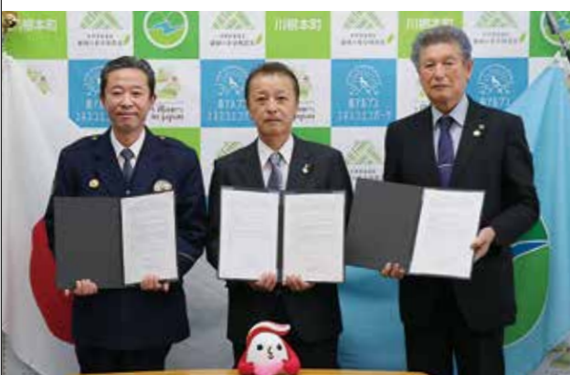
島田警察署と静岡犯罪被害者支援センターと三者協定を締結。

犯罪被害者等基本法に基づき、犯罪被害者などの支援に関する基本理念や町や町民などの責務を定め、犯罪被害者が平穏な生活を回復できるように支援することを目的に、10月1日に川根本町犯罪被害者等支援条例を施行しました。