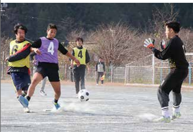
白熱した球際の競り合いを見せた参加者

町スポーツ協会が主催する毎年の恒例イベント「町民サッカー大会」が、中川根第一小学校のグラウンドを会場に行われ、全5チーム、出場者約50名が熱戦を繰り広げました。