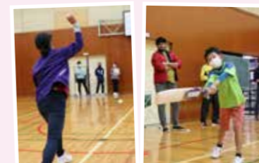
▶ インドで親しまれるスポーツ「クリケット」を通じた交流