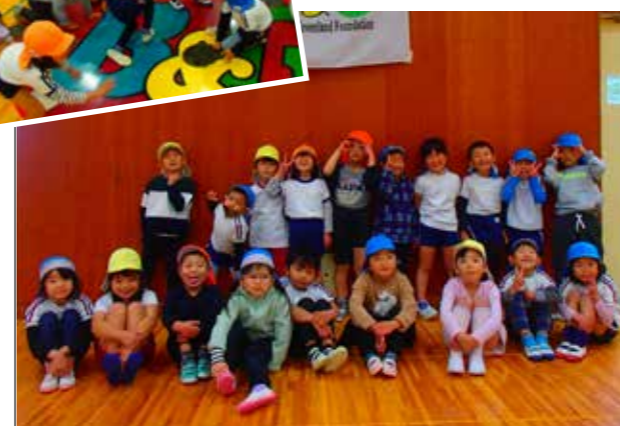
他園のお友だちがたくさんできました！

町内の保育園児を対象とし、年少から約2年間行われた「幼児運動プログラム」が昨年12月に終了しました。