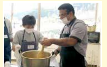
▶ 町内に住む外国人と料理交流 ▶ 本川根小学校で防災教室