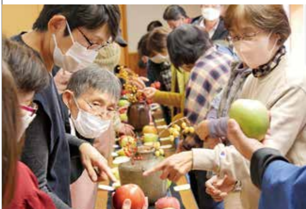
「全然違うね！」50種類のリンゴを見比べる参加者

公開講座～いい暮らしって何だろう？ 50種類のリンゴと庭の果樹から考える中山間地の未来～