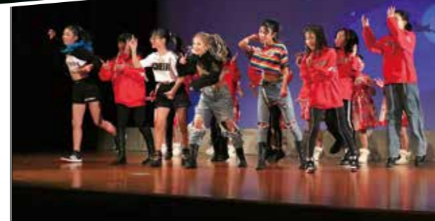
息の合ったダンスに会場は拍手喝采

キッズダンスグループHAPPY ☆ STYLEのダンス発表会が町文化会館で開催され、小学生から高校生までの18人が華麗なダンスを披露しました。