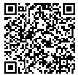
▲浸水キキクル (気象庁浸水害情報)