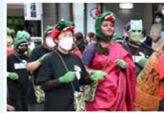
▶ 千頭大祭で仮装して一緒に地域を練り歩き