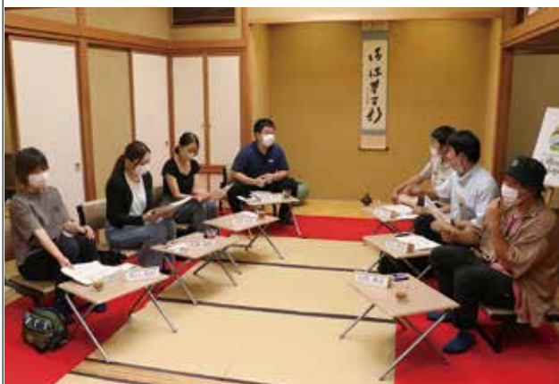
和やかな雰囲気の中、川根茶を楽しみながら話す参加者

NPO法人「日本で最も美しい村」連合は、「川根本町の未来」をテーマとした町内の若者同士による意見交換会「U 35 未来創造会議」を、フォーレなかかわね茶茗館にて開催しました。