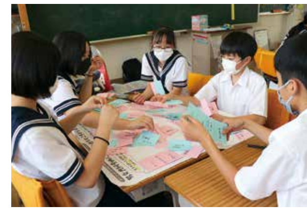
性別が持つイメージを書き出す中学生たち

第3次男女共同参画プランを策定するためのワークショップが中学生を対象に初めて開催されました。