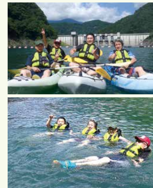
接岨湖の大自然を満喫中のお客様

(一社)エコティかわね 川根本町桑野山424-6 ☎(58)7000 FAX (58) 7001 Eメール: ecotkawane@gmail.com