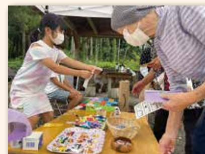
▲ てんでんこでは地域の人たちとの交流イベントも開催されています。