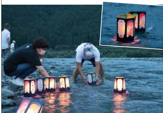
水面に灯籠を浮かべる参加者ら

久野脇スポーツ広場で、久野脇親水公園管理運営組合と久野脇区、同区生涯学習委員が共催した「お盆灯籠流し」が行われました。