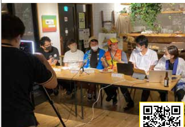
軽快なおしゃべりで特産品を紹介