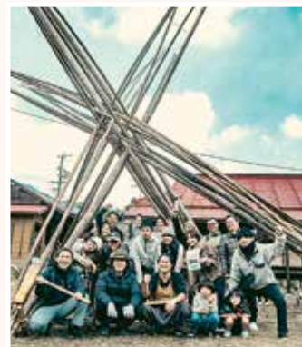
ゆる宿 vocketto（青部区）の コミュニティから広がる出会い

川根本町に移住して、数えきれないほどの恩をいただきました。今度は自分ができることで少しずつお返しして、この町の好循環の一部になりたいと思っています。