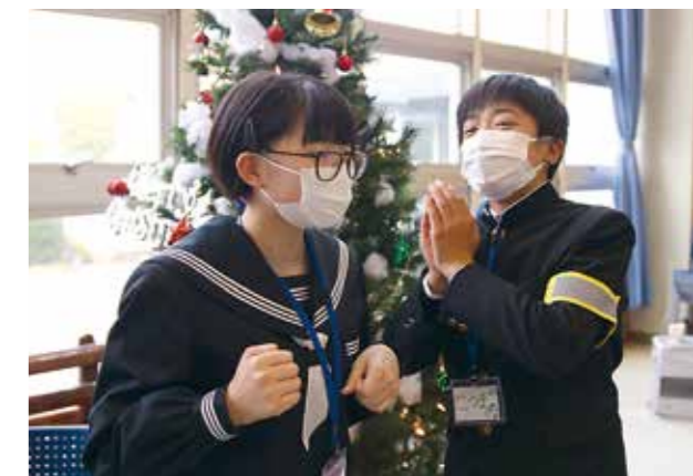
伝言ゲームで飯高中の生徒(左)に必死に伝える

同校での交流後、両校の生徒たちは千頭駅へ向かいました。道中のバスの中で、中川根中学校の生徒が方言クイズを出したり、地域の案内をしたりして一層交流を深めていました。