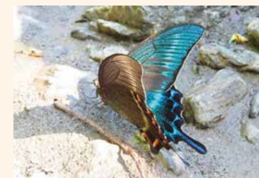
(上)昆虫観察入門教室。何が採れたかな？ (下)町内で撮影したミヤマカラスアゲハ