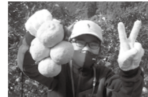
鈴なりのゆずピース!