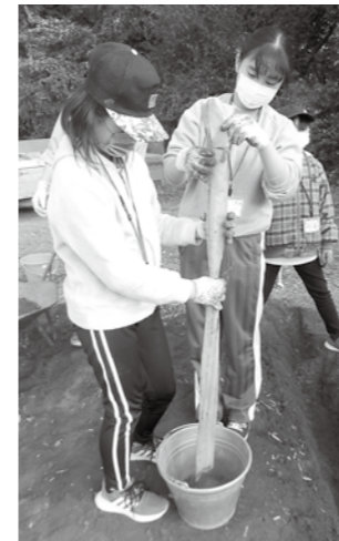
どんな自然薯が出てくるかな