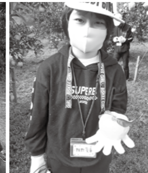
きれいなゆずがとれました