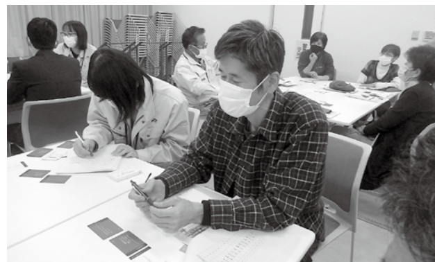
▲カードゲームに挑戦する参加者

今後も、町は空き家の利活用に関するセミナーなどを定期的に開催する予定です。空き家を負の財産として考えるのではなく、地域活性化の資源として活用できるように、家庭や地域、町が一体となって取り組んで行くことが必要です。