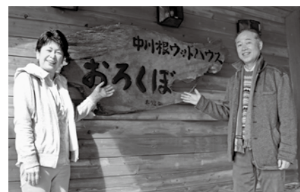
ウッドハウスが家族のつながりを確認する憩いの場所に

この町も他の過疎地域同様に、人口減少という深刻な課題を抱えています。毎年のように町を支えるすばらしい人たちが町外に流出してしまう、そんな現状にずっと歯がゆさを感じていました。町に「魅力ある会社」や「魅力ある職種」が増えれば、人口流出に歯止めを掛け