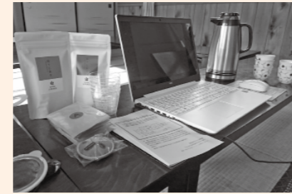
オンラインツアー当日。パソコンの前で準備万端！

だとタイミングでなかなか言いづらい「トイレに行く」ことも、周りに気を遣わずに済みます。 もちろんネット環境が整っていなかったり、ずっとパソコンの画面を見ているのが辛かったり…という面もあるのですが、オンラインでも十分に楽しむことができるなあとというのが印象でした。こんな時だからこそ、少し変わったツアーに参加してみるのも良いかもしれません。