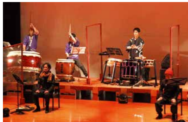
動物やかしわの木々を演じた俳優陣を和太鼓が盛り上げました

「ここでしか割れない・ここでしか観れない」赤石太鼓保存会が静岡舞台芸術センター (SPAC) と共演