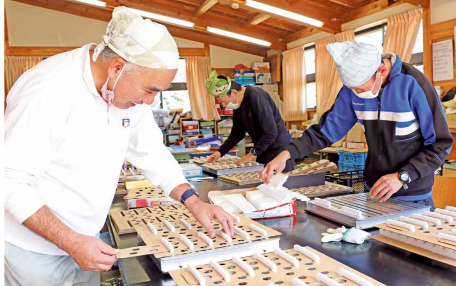
仕事に励むみどりの丘えまつの利用者の皆さん