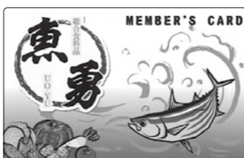
◆魚勇プリベイドカード