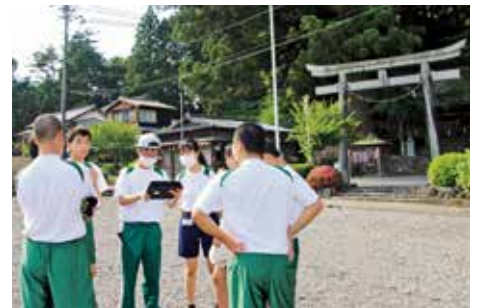
徳山地区の方による紹介動画を見ながらフィールドワーク

徳山地区の方や役場から、町のことを少しずつ教えてもらった川根高校の1年生。知ることをさらに深め、『川根の価値ある場所』を自分たちで見つけ出す取り組みをしていきます。川根地域の地元生と、それ以外の県内・県外の川根留學生に分かれ、それぞれの視点で考え、共通点や相違点を発見していく予定です。 川根高校ならではの地域性と生徒のバックグラウンドを活かし、町全体を教室として、地域を探究していきます。