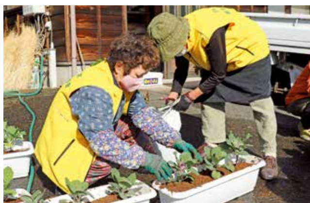
更正保護女性会の皆さんが一苗ずつ丁寧に植え替えました

この日、川根本町地区更正保護女性会の皆さんが崎平区の会員宅で、これまで大切に育ててきた「葉牡丹の苗」を、町内小中学校と川根高校に寄贈するためにプランターに植え替える作業を行いました。