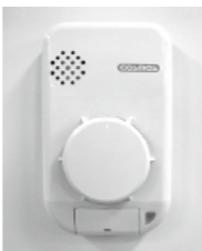
壁に取り付けるタイプの火災警報器