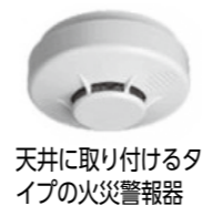
天井に取り付けるタイプの火災警報器

これらの逃げ遅れによる死者をなくそうと、消防法の一部が改正され、新築住宅は平成18年6月1日から、既存の住宅にあっては、平成21年6月1日から設置が義務となっています。