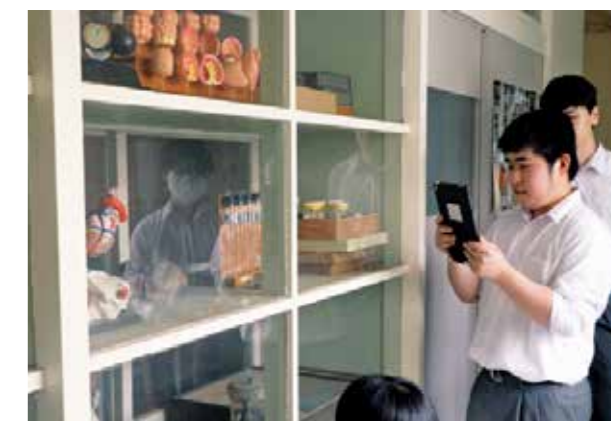
指令書に答えるため 校内を散策する生徒たち（撮影時はマスクを外しています）

今回の授業を皮切りに、生徒たちはプロのデザイナーの指導を受けながらマップ完成を目指し、オープンスクールなどで中学生や地域に向けて配布する予定です。