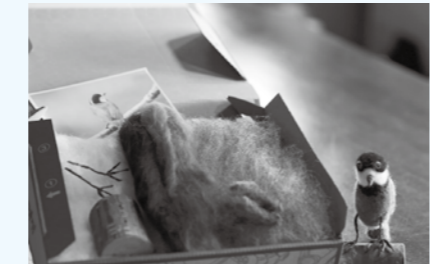
通販サイト【Kawane Stories】で販売している、『ヤマガラ・シジウカラが作れる羊毛フェルトのキット』

川根の日常のストーリーを伝えたいという想いから、エコティかわねでも通販サイトをオープンしました。普段はイベントを提供する立場ですが、それができない中で新しい試み。コロナの影響で大打撃なのはとても痛かったです。身近な大事なものを考えたり、新しいことに挑戦したりする期間をもらったと思います。前向きに取り組んでいます。