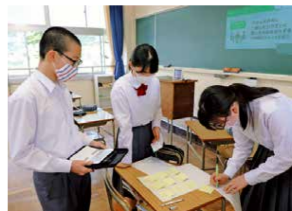
グループで話し合う生徒たち