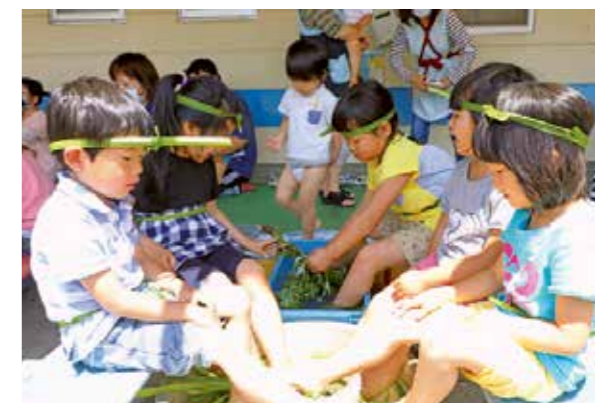
よもぎとショウブの足湯にご満悦の様子の子園児たち

足湯に入った後、園児たちは園庭で、こいのぼりの歌を歌ったり、動物のまねをする体操をしたりして元気いっぱい楽しみました。