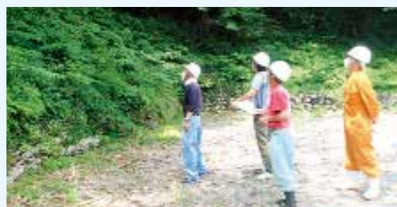
急傾斜地崩壊危険区域を確認▶

近年頻発する「局地的豪雨」への対応には、避難マニュアルを過信することなく、皆さんが自ら危険を判断し、自主避難をするといった「防災意識の向上」が必要不可欠です。地域特有の災害発生原因や避難経路の問題を確認し、安全で適切な避難ルートを検討する「手作りハザードマップ」の作成や、土砂災害防災訓練への参加により、地域の皆さま一人ひとりが「防災意識の向上」を図れるよう、これからも訓練の継続をお願いします。