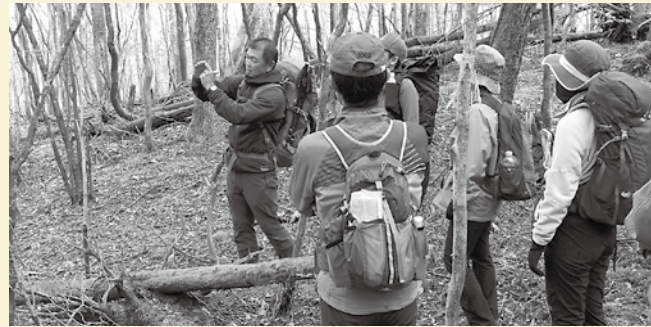
トレッキングガイド養成講座の様子 (11月23日)

当は話がつまらないと思っていたり、腹痛でトイレに行きたいけど言い出せずに我慢している、ということもあるかもしれません。参加者が楽しめないツアーになったら、本末転倒です。 これが正解ということはきっとないのですが、ガイド養成講座の際にいただいた資料にあった言葉「その場その場で最もベストと考えられることを考え、選択し実行して、うまくいってもいなくてもまた考えて…」を繰り返していくしかないのだろうと思います。