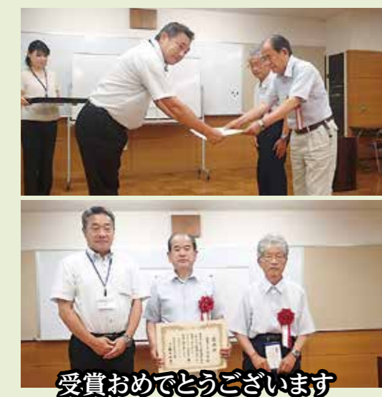
受賞おめでとうございます

編集 幸記 インドではペットボトルの水を飲む際に、口に付けないように流し込むように飲むので、飲み口についていた雑菌が気温で増えるのを防ぐ、安全のための生活習慣だそうです。日本でも飲みかけを車内や日なたに放置するのは同じく危険、季節に関係なくご注意を。瀧智之