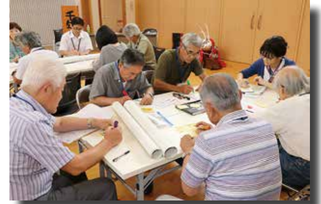
●町内各地区の保存会が会しての意見交換となりました

参加者からは「祭りは見るものであり参加するものでもある」「地域での大切なコミュニケーションの場」といった声が聞かれました。