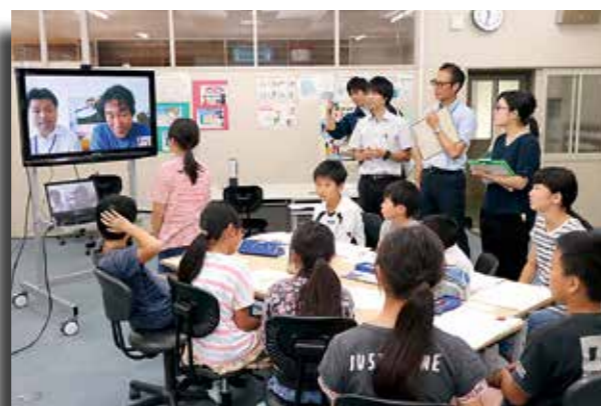
●テレビ会議をとおして南魚沼市の農家に質問する児童

児童から「毎年特Aランクのお米の味を維持するためにやっていることは」といった質問が出されていました。