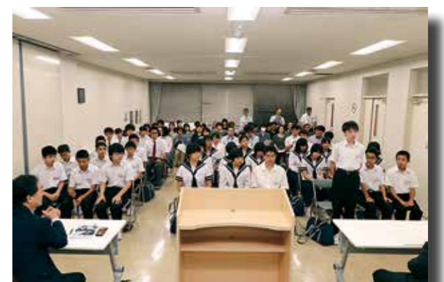
●参加生徒が一人ずつ研修への抱負を話しました

参加する生徒から「積極的にコミュニケーションしたい」など研修に対する意欲が述べられたのに対し、大橋教育長からは「英語はコミュニケーション手段の一つ、上手に話せなくても思いは伝わる」と応援の言葉が送られました。