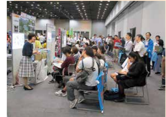
●「特色を活かした学びができる」高校を選ぶという意識は確実に高まっています。

全国から川根へ、留学生への取り組み 本年度の川根高校の生徒数は139人。年々減少する生徒数に学校存続への危機感を持ち、学区をこえて生徒を募集する「川根留学生制度」を5年前に立ち上げました。 開始当初の留学生は2人でしたが、制度が少しずつ周知されてきたことや山村留学の機運が高まってきたことにより年々増加、現在は68人となり、全校生徒のほぼ半数を占めるようになりました。 平成30年度には県内の公立高校として初となる全国公募を開始、今年度は東京都や神奈川県から6人が入学しました。 現在、川根留学生は地元川根地域の生徒たちとの交流をとおしてお互いに高めあいがら勉強や部活動に積極的に取り組んでいます。 また、川根高校では、地元の中学 生や保護者に地域の高校ならではの様々な取り組みを紹介し、学校の魅力を知っていただくことを目的とした進路説明会や座談会を企画しています。座談会は、在校生自らが学校生活の様子を紹介するほか、高校生生活への不安や心配ごとなど中学生の相談に応える場になっています。 留学生に対しては、ホームページでの紹介の他、一日体験入学やオープンスクールの他、静岡市や浜松市での説明会を開催しています。 6月には、全国公募を行っている高校が一堂に会する「地域の未来フェスタ」が東京と名古屋で開催され、川根高校も参加しました。 東京会場にはおよそ650組の来場があり、川根高校のブースにも多くの中学生が訪れていました。