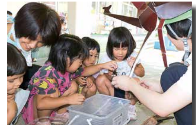
●ダムの職員からカブトムシを手渡される園児たち

国土交通省長島ダム管理所から、桜保育園と三ツ星保育園に対しカブトムシのオスとメスがそれぞれ5匹ずつ寄贈されました。 このカブトムシの寄贈は、接岨湖周辺にある流木の処理場で自然繁殖するようになったことから、園児たちに楽しんでもらおうと4年前から行われているものです。 長島ダムの職員からカブトムシを手渡された園児たちは「固い!!」「カッコイイ!!」などと歓声を上げながら、昆虫とふれあいました。