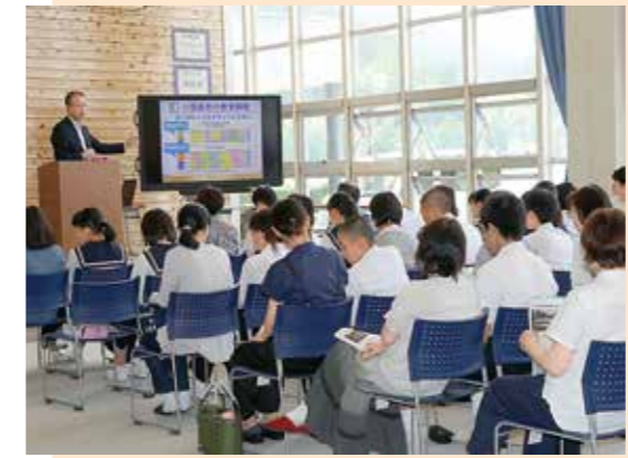
●中川根中学校で保護者も交えて行われた進路説明会。