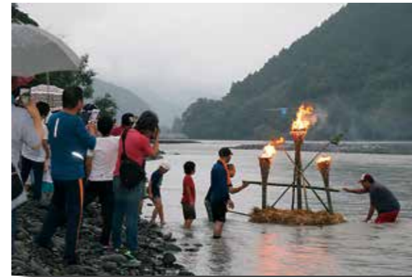
●雨の中大井川に奉納されるたい

町指定無形文化財として平谷地区で毎年行われている「平谷の流したい」が実施されました。