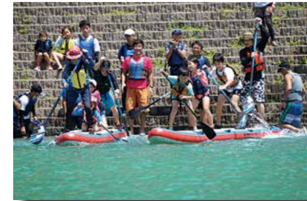
●4人乗りのドラゴン SUP でレースに挑む参加者

長島ダムの奥大井接岨湖カヌー競技場を会場としてパドルスポーツの体験会が開催されました。今回で3回目となるこの催しには、家族連れを中心に町内外から81人が参加しました。 スタッフからパドルの使い方や乗り込み方、安全のための注意点を習った参加者は、思い思いの艇で湖へ漕ぎ出し歓声をあげていました。 当日はカヤックやカナディアンなどのカヌーのほか、ボードの上に立って乗るSUP(スタンドアップパドル)が用意され、4人乗りの大きなSUPを使用したミニレースも行われました。