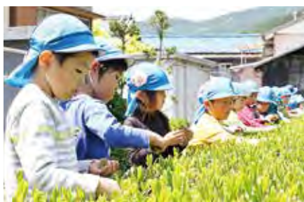
▲飽きることなく、1時間にわたり収穫。