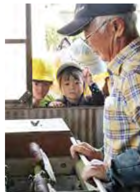
▶年長児以外の子どもたちも、散歩しながら茶工場を見学。機械に興味津々。