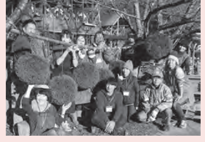
12月開催の「大井川のほとりで杉玉づくり体験」にて。リピーターも多く、年末の恒例行事となりました。

私 は「エコティかわね」を地域から愛され、頼りにされる組織にしたいと思っています。「自分たちのやりたいことをやる」のは根底にあります。これからは「地域に求められていること」を実現できる組織でありたいのです。「うちの町にエコティがあって良かったね」と言われるよう、頑張ります!!