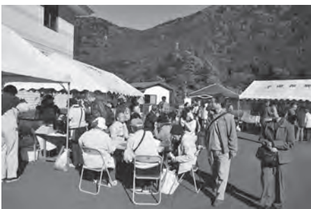
奥大井接岨湖もみじまつり

こうした永年にわたる長島ダムでの上下流域の交流活動が、選考委員会にて高く評価され、今回の受賞につながりました。