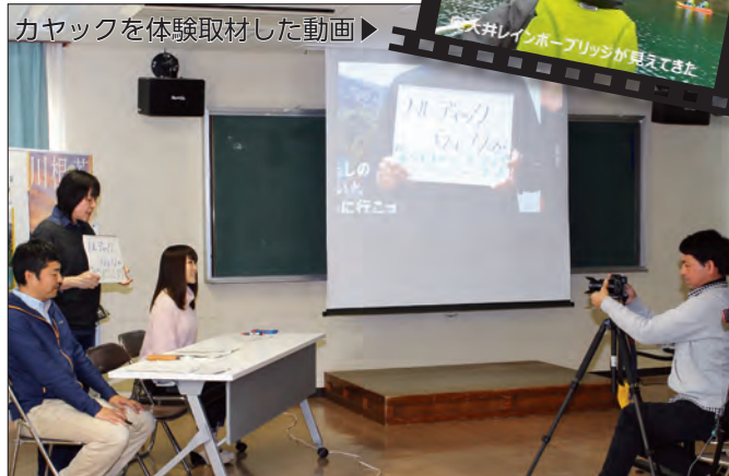
制作した動画のテーマについて、受講者自らが説明しました