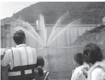
森と湖に親しむ旬間イベント