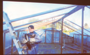
式典では、現地での活動写真とともにビデオメッセージが上映されました。

昨年3月から今年10月まで、アメリカでの海外農業研修に参加しています。今、私は、アメリカ西側のシアトルからフェリーで渡った島の農場で働いています。人口2万人ほど、森林が多く自然豊かで野生動物も頻繁に出没します。島民の人柄もおおらかで、自分が19年間過ごした川根本町によく似ています。